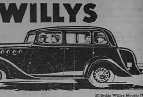
El Sedán Willys Modelo 77

Las Pastillas RICOTS dan alivio inmediato. También curan la flatulencia y malestar antes y después de las comidas. De venta en todas las boticas.